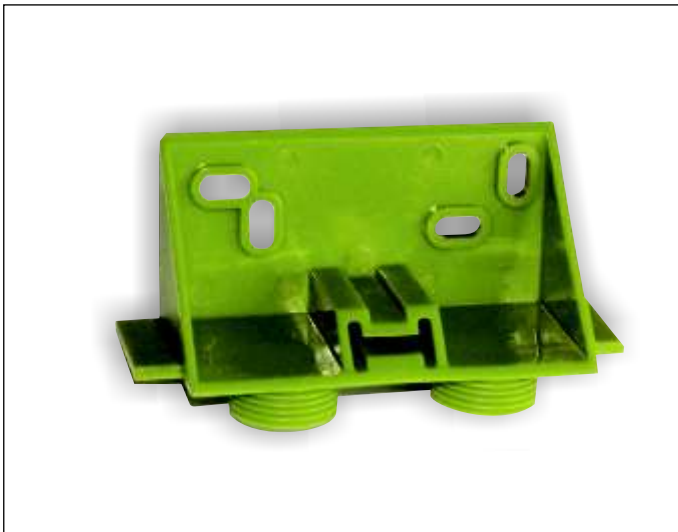
Art.-Nr. 1-005912 Art.-Bez. Vormontageschablone Standard

Ein vereinfachter Montageablauf auf der Baustelle lässt sich durch die Verwendung der Vormontageschablone mit Wandträger realisieren. Wandabstände und Anschlussmaße lassen sich ohne Montage des Heizkörpers vorbereiten.