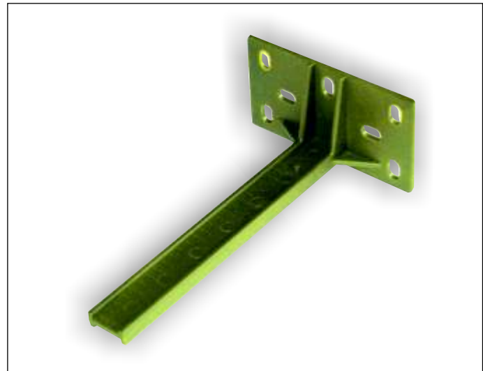
Art.-Nr. 1-005913 Art.-Bez. Wandträger für Vormontageschablone Standard