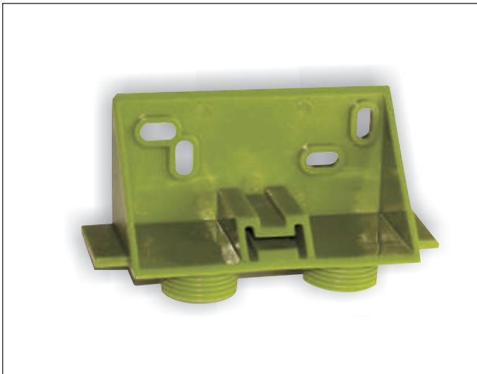
Art.-Nr. 1-005912 Art.-Bez. Vormontageschablone Standard

Ein vereinfachter Montageablauf auf der Baustelle lässt sich durch die Verwendung der Vormontageschablone mit Wandträger realisieren. Wandabstände und Anschlussmaße lassen sich ohne Montage des Heizkörpers vorbereiten.